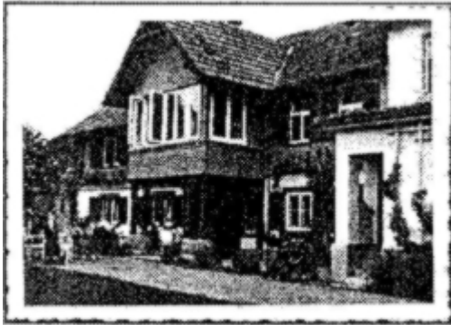
Heimschule Brachenreuthe 1959

Wir waren also zu einer Zusammenarbeit einig,